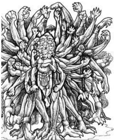
links: een Hekantoncheir rechts: een Cycloop

Aarde en hemel heten bij de Grieken Gaia (ἡ Γαῖα) en Oeranos (ὁ Οὐρανός). Zij werden beschouwd als een machtig godenpaar dat heerste over het heelal. Gaia, Moeder Aarde, bracht vreemde reuzenkinderen ter wereld. Eerst werden de Hekatoncheiren geboren. Zij waren reuzen met 50 koppen en honderd armen. Oeranos schaamde zich dat hij de vader was van zulke monsters. Hij smeedt ze dan ook in een diepe, zware afgrond: de Tartaros . De kinderen die ze daarna kregen waren de Cyclopen , reuzen met maar één oog in het midden van hun voorhoofd. Ook zij werden door Oeranos in de Tartaros gesmeten. Daarna kreeg Gaia weer een aantal kinderen. Dit keer waren het twaalf knappe reuzen, zes jongens en zes meisjes. Zij werden de Titanen genoemd.